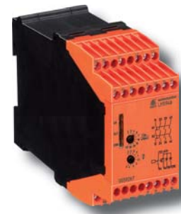
Stillstandswächter LH 5946

Kat. 4 / PL e nach DIN EN ISO 13849-1 SIL CL 3 nach IEC/EN 62061 SIL 3 nach IEC/EN 61508, IEC/EN 61511 und EN 61800-5-2