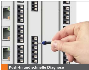
Push-In und schnelle Diagnose

Bei der Entwicklung wurde besonderes Augenmerk auf die mechanische Stabilität gelegt. Dies ermöglicht auch den Geräteeinsatz in mobilen Anwendungen. Reduzieren Sie Ihren Montageaufwand – mit nur wenigen Gehäusebauteilen zum fertigen Gerät. Steigern Sie Ihren Automatisierungsgrad – die Push-In-Klemmen erfüllen die hohen Anforderungen an den Reflow-Lötprozess. Das modulare Gehäusesystem mit Baubreiten ab 12,5 mm ermöglicht eine maßgeschneiderte Realisierung einer Vielzahl von kundenspezifischen Applikationen. Optional können auch gängige Kommunikationsschnittstellen integriert werden.