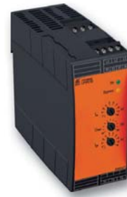
Sanftanlaufgerät UH 9018