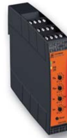
Softstarter UG 9019