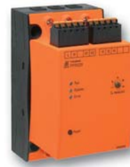
Sanftanlaufgerät PF 9029