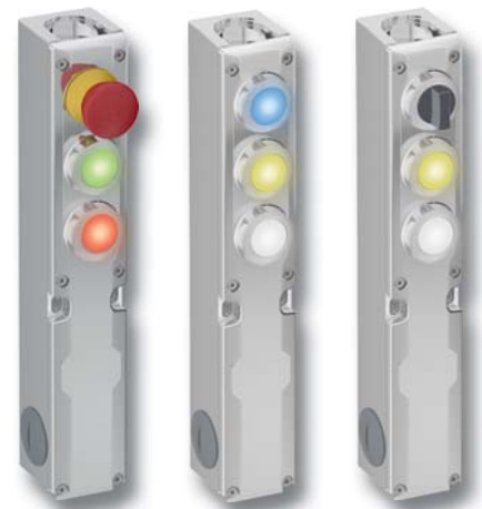
Optionsmodul TTN / TTT / TTW

Die Abbildung zeigt eine Anlage mit mehreren Zugängen. Vor Freigabe des Hauptzugangs durch die Zuhalteeinheit muss erst der Freigabetaster am Optionsmodul gedrückt werden. Hierdurch wird gewährleistet, dass die Maschine oder Anlage in einen sicheren Zustand geht. Erst dann ist ein Öffnen des Hauptzugangs möglich und die Wartungstüren können geöffnet werden. Erst wenn die Schutztüren fachgerecht verschlossen sind und die Schlüssel zurück in der Zuhalteeinheit sind, kann die Anlage über den zweiten Freigabetaster wieder gestartet werden. Das Optionsmodul kann auch als alleinstehendes Befehlsgerät in die Anlagensteuerung eingebunden werden, um beispielsweise Fehlteile auszuschleusen oder Prozessgeschwindigkeiten anzupassen.