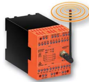
Funk-Sicherheitsmodul BI 5910

Performance Level (PL) e und Kategorie 4 nach EN ISO 13849-1: 2008 Safety Integrity Level (SIL 3) nach IEC/EN 61508