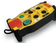
Handsender RE 5910