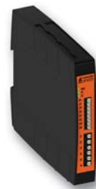
Not-Aus-Modul UF 6925