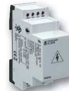
Vorschaltgerät RL 5898