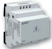
Vorschaltgerät RP 5898