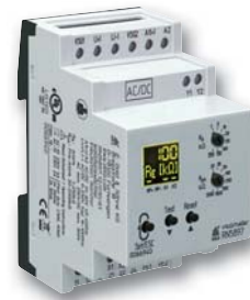
Isolationswächter RN 5897