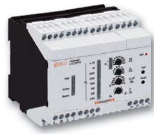
Isolationswächter LK 5896/900