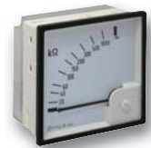
Anzeigeelement RP 5898