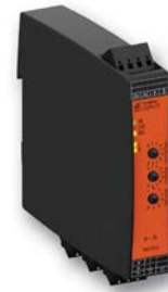
1-phasiger intelligenter Motorstarter UG 9411